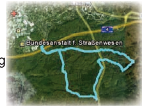
Walkingrunde im GPS

Ob Jung oder Alt, wir bieten für jeden das richtige Fitnessprogramm. Bringt auch Freunde und Bekannte mit.