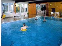
Hallenbad im Haus